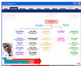
Structure du Conseil d'administration (organigramme)

EduChallenge est un logiciel d'apprentissage multimédia qui permet aux participants, et notamment aux étudiants des grandes écoles de comprendre toutes les difficultés et différentes formes de résistance qui existent dans un processus.