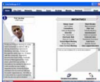
Les profils personnels