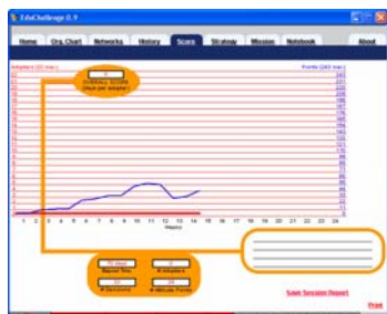
Vos « Résultats » peuvent s'afficher sur demande

Dans la simulation EducChallenge, il faudra relever le défi suivant : présenter une innovation dans une grande école de commerce, Humfeld University Graduate School of Business (GSM).