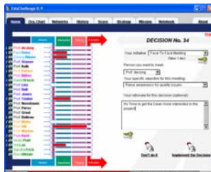
Le Tableau de bord vous permet d'observer votre progression à chaque instant