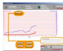
Vos « Résultats »