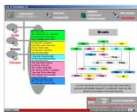
Les Réseaux de l'Organisation