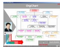
Organigramme de la Direction

Dans la simulation LingHe, il faudra relever le défi suivant : présenter une innovation dans une entreprise chinoise (Ling He Company (LHC)). Votre mission, comme formulé par le Siège social de SinoCom, une entreprise publique contrôlée par l'Industrie de Ministère de l'Information et sous lequel aussi LHC fonctionne. Vous avez 6 mois pour essayer de faire adopter la Direction (des PREMIERS MINISTRES) par l'équipe de direction supérieure de LHC comme la partie d'un plan de restructuration majeur. Jusqu'à présent la Direction LHC semble avoir retardé sa mise en oeuvre.