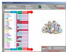
Le Tableau de bord vous permet d'observer votre progression à chaque instant